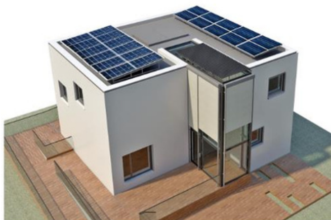
Figure 3.0 Dual-source residential nZEB Bucharest

Clădirea este o locuință unifamilială eficientă din punct de vedere energetic, cu o suprafață construită brută de 182 m 2 , o suprafață utilă de 132 m 2 și un volum de 265 m 3 . Designul său valorifică iluminatul natural, profitând la maximum de orientarea amplasamentului. O seră integrată constituie un element central al construcției. Toate componentele clădirii sunt realizate din materiale 100% reciclabile. Informațiile generale privind clădirea sunt prezentate în Tabelul 3.0, iar Figura 3.0 oferă o imagine a acesteia.